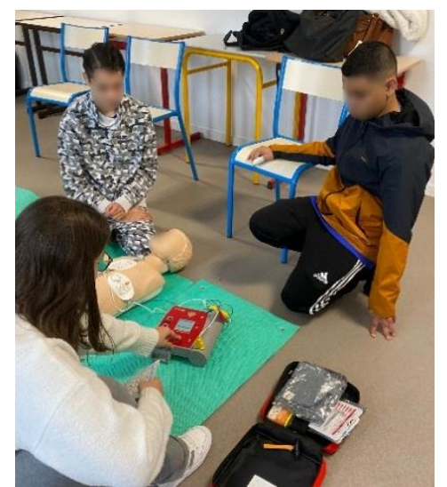
Le groupe Educlasse