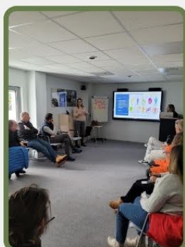
JOURNÉE DE SENSIBILISATION AU HANDICAP AUPRÈS DES ENTREPRISES. (VOLVO EQUIPMENT)

MALGRÉ CELA, NOUS AVONS POURSUIVI LE DÉVELOPPEMENT DE BEAUX PROJETS EN 2024 ET 2025 S'ANNONCE TOUT AUSSI AMBITIEUSE.