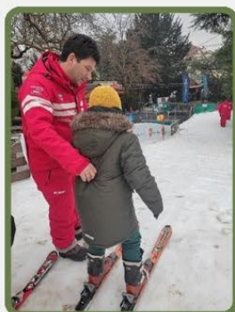
SORTIE DE NOËL POUR LE GROUPE ARC EN CIEL DU SESSAD DU PRÉ D'ORIENT

EN CETTE FIN DE 2024, C'EST AVEC BEAUCOUP DE FIERTE QUE NOUS SOMMES HEUREUX DE VOUS ADRESSER CETTE DERNIÈRE NEWSLETTER DE L'ANNÉE.