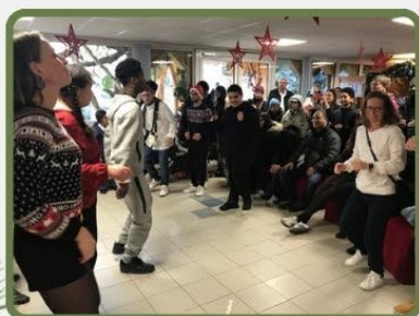
CHALETS EN FÊTE LE 14 DÉCEMBRE À L'EMPRO