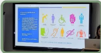
SENSIBILISATION DES ENTREPRISES AU HANDICAP