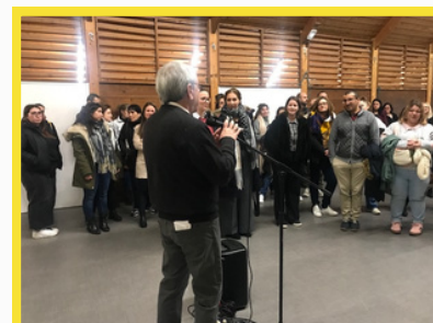
Voeux aux professionnels, Galette des rois et des reines le 12 janvier